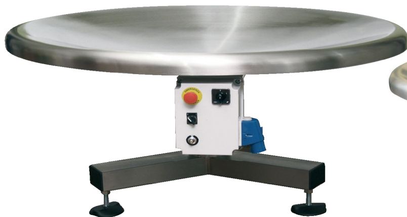
TR 1400 CONCAVO INOX INVERTER

The end-of-line rotary tables are made completely in stainless steel with concave or flat trays and mechanical or electronic (inverter) speed variator.