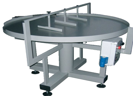
TR 1200 ACCUMULO E SMISTAMENTO