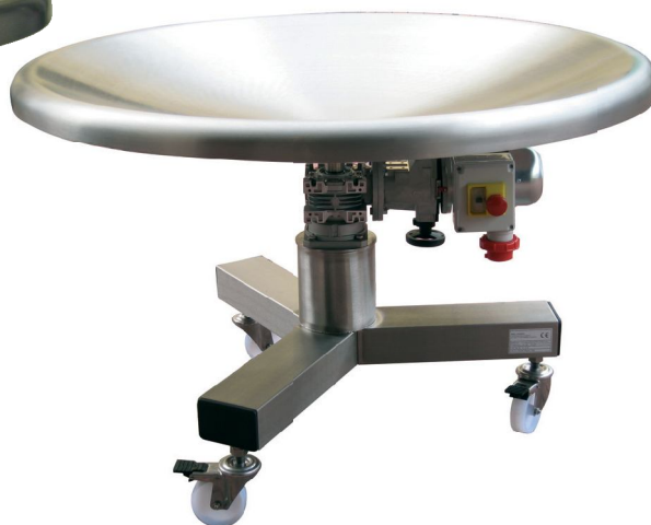
TR 1200 INOX CON RUOTE