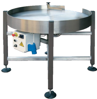
TR 800 ACCUMULO